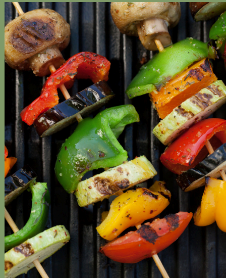
グリルする guriru suru