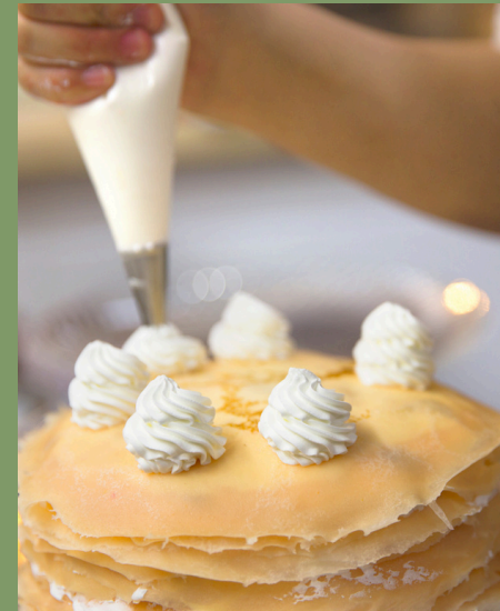
パイピングする paipingu suru